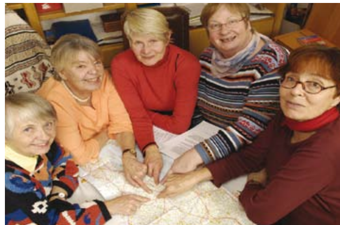
Mietwohnprojekt OLGA in Nürnberg

Seien Sie herzlich eingeladen zu einem anregenden Austausch über neue Lösungen, gemeinsame Idee und aktuelle Vorhaben!