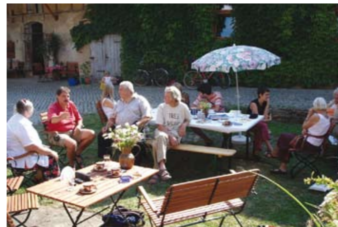
Anders Wohnen im Alter - Obmannstedt

Bitte wenden Sie sich an die Tourismus GmbH Erfurt Servicetelefon 0361 - 6640 110 www.erfurt-tourismus.de