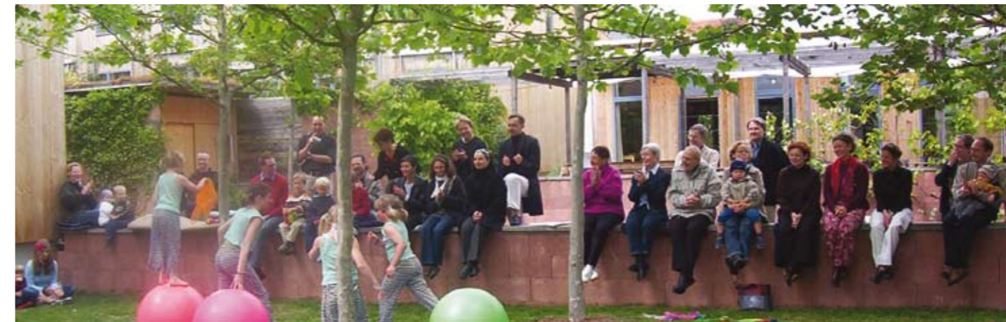
Wohnhaus e.G. Weimar