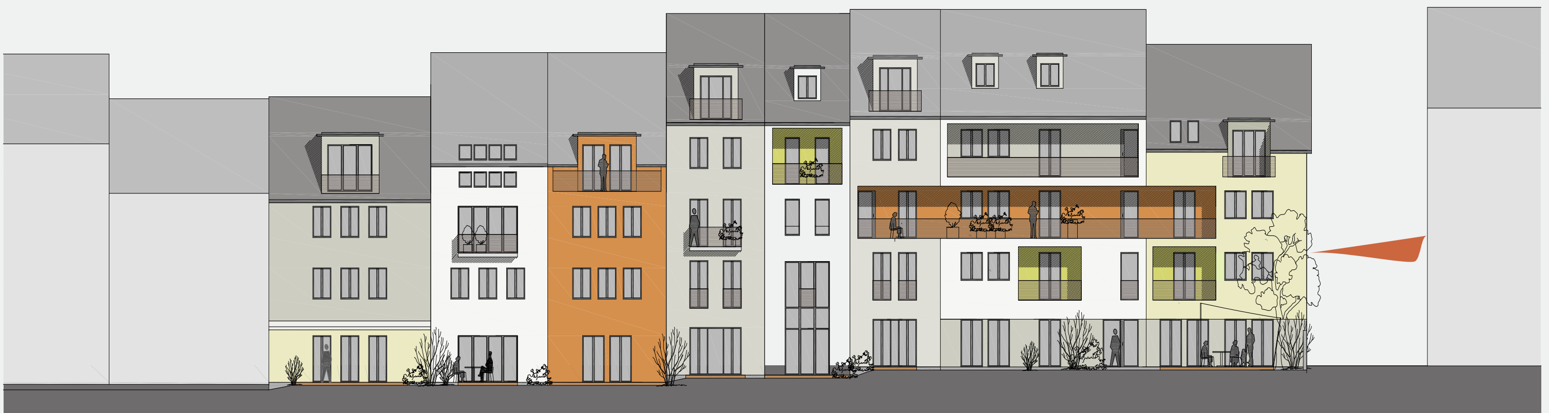
Nordfassade Gartenseite 1:200