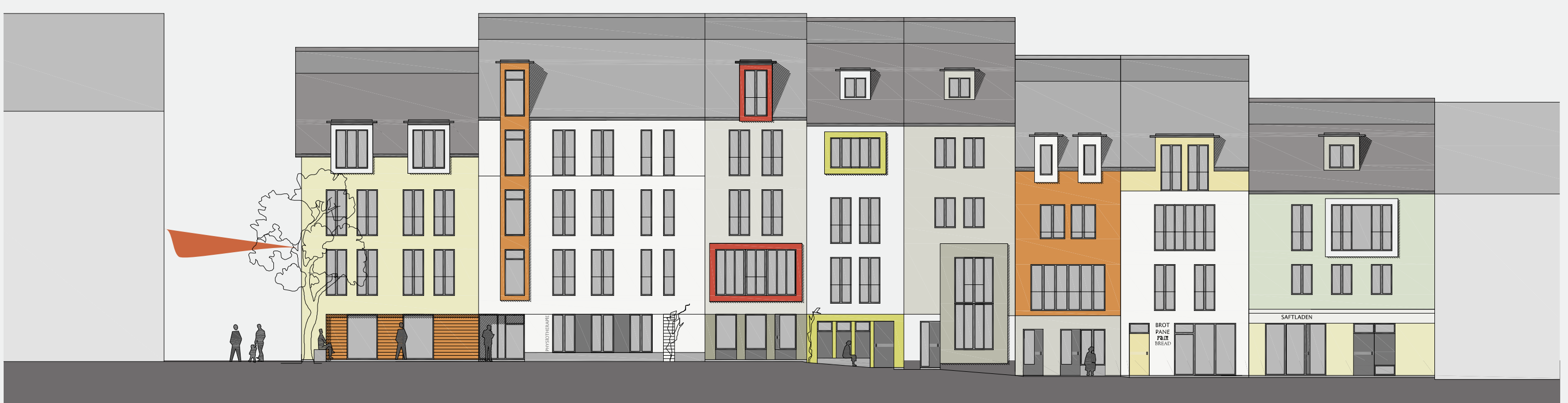
Südfassade Straßenseite 1:200