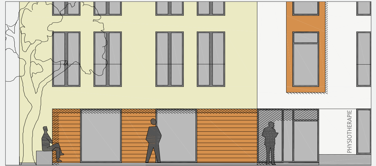
Ausschnitt Erdgeschosszone Mehrfamilienhaus

Bürgerschaft | Neue Wohnformen als Impuls für Begegnungen von Jung & Alt, bürgerschaftliches Engagement und Nachbarschaftshilfe im Alltag.